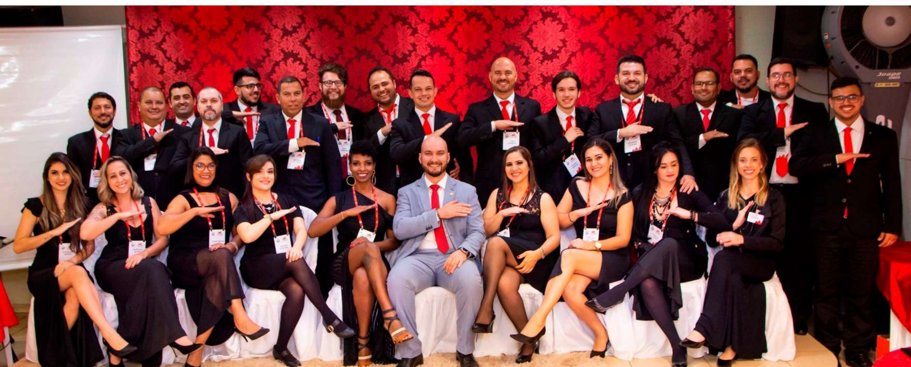
Formatura do MasterMind Lince