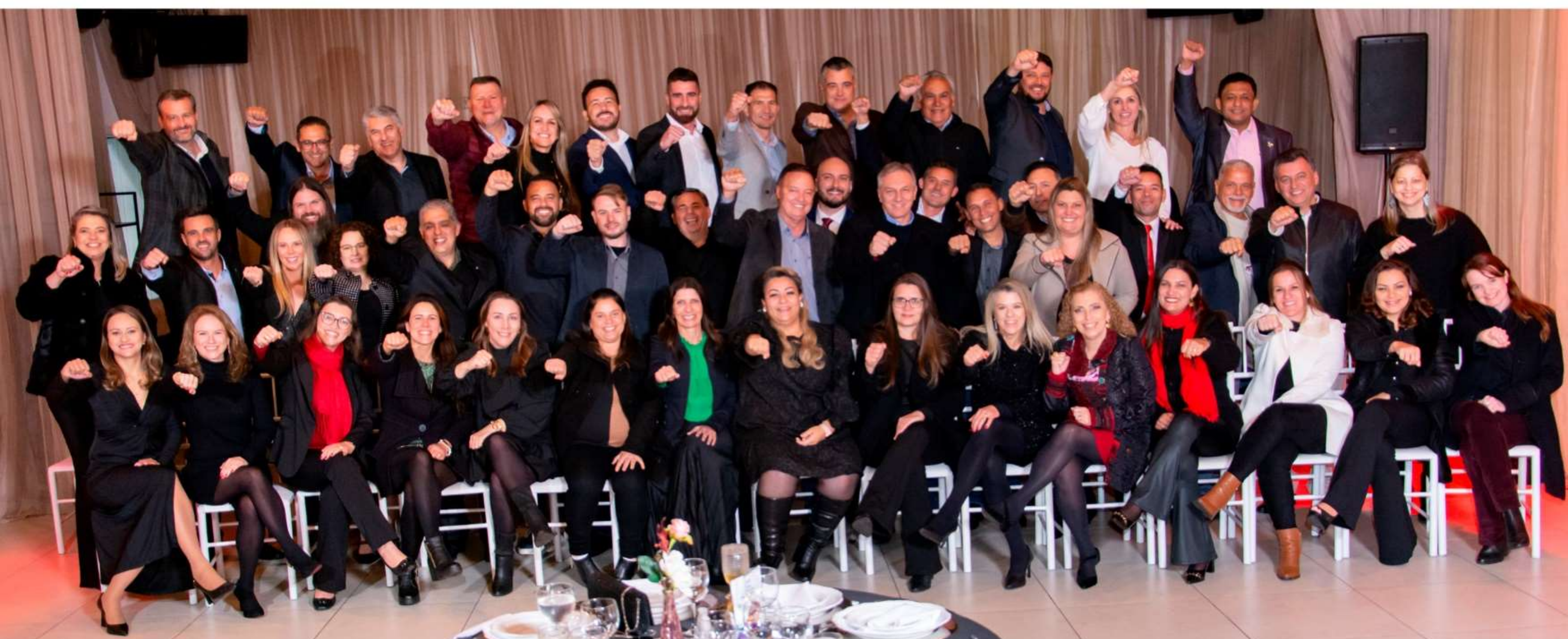
Turma de lideranças públicas de Colombo