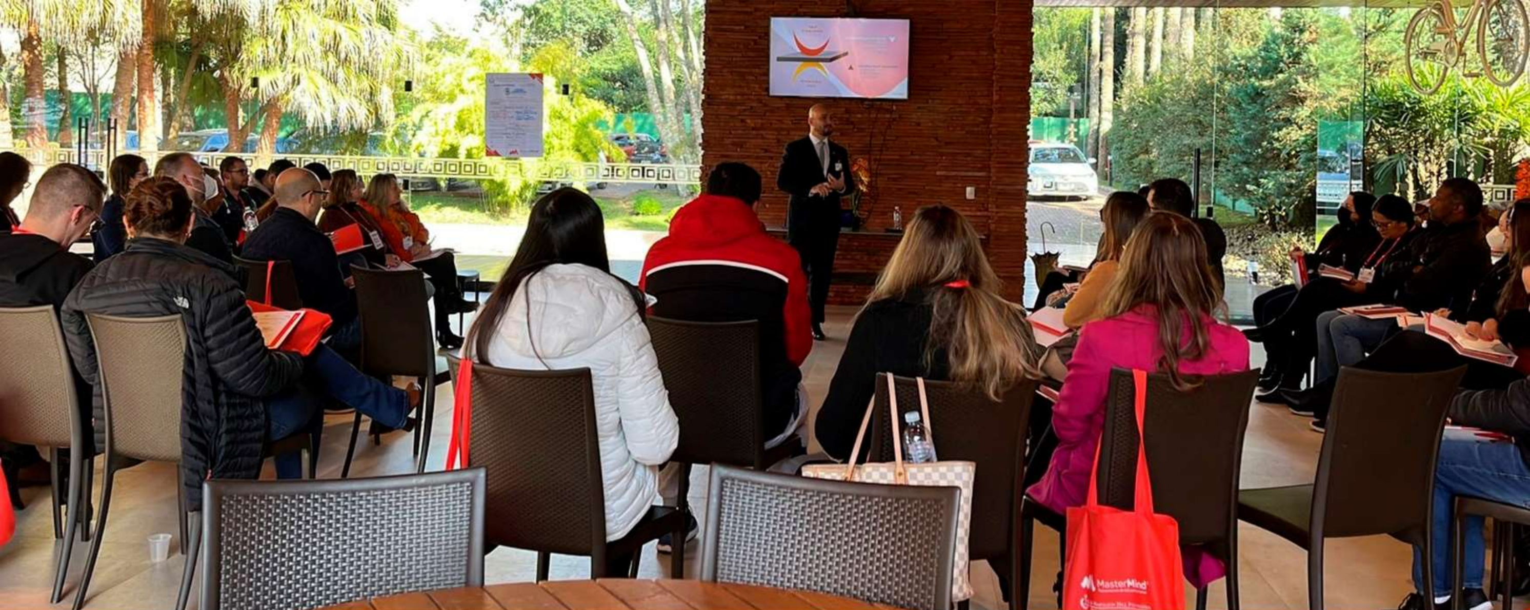
Turma de lideranças públicas de Campina Grande do Sul